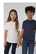
SOL'S REGENT KIDS 11970