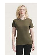
SOL'S REGENT WOMEN 01825