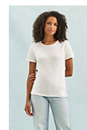
SOL'S Imperial WOMEN 11502