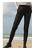
SOL'S JET WOMEN 03809