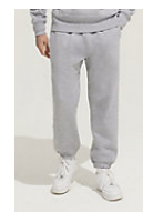
SOL'S CENTURY 03992