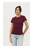
SOL'S PIONEER WOMEN