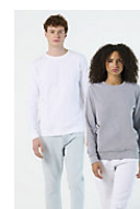
SOL'S COMET 03574