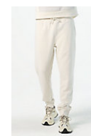
SOL'S JUMBO 03810