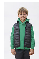
SOL'S STREAM BW KIDS